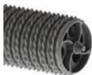
Kotouče D / Ringe D