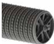
Kotouče C / Ringe C

Das System TitanLoc zum perfekten axialen Anziehen der Cambridge-Gusssegmenten auf der Welle. Dies garantiert, für jedes Segment einen geringeren Verschleiß und eine längere Lebensdauer.