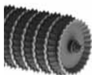
Kotouče Z / Ringe Z